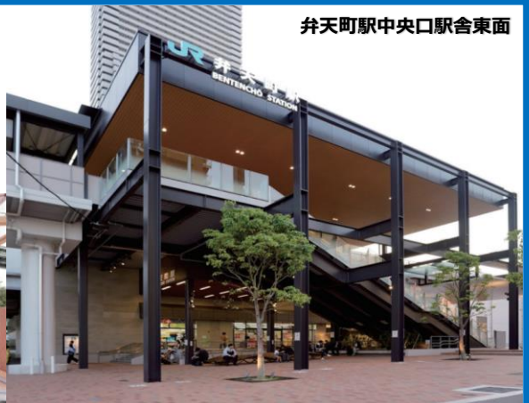
弁天町駅中央駅舎東面