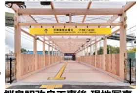
桜島駅改良工事後 現地写真