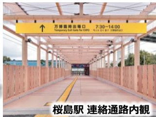
桜島駅 連絡通路内観