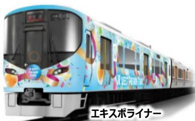
エクスポライナー

万博開幕に向けて準備を進め、他交通事業者等と連携を図りながら、万博来場者を含むお客様の安全確保を最優先に、鉄道ネットワークを活かした万博アクセス向上を実現した。