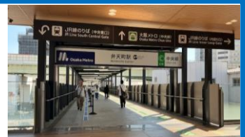
弁天町駅連絡通路

1時間当たり最大9本の運行から12本に増やせるよう、西九条駅の改良工事を実施。これにより新大阪駅と桜島駅間を結ぶ「エクスポライナー」の運行が可能となった。