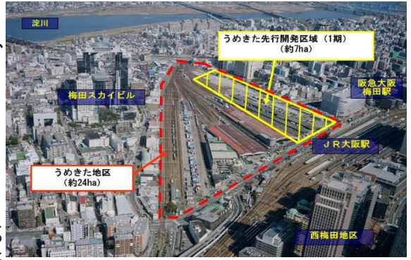
《開発前のうめきた地区の状況(2004年)》

<課題となっていた点> 関西の発展を牽引するリーディングプロジェクトとして、地球環境問題や大規模災害の対応はもとより世界水準の都市空間を持つ都市となるよう、公民連携まちづくりを推進する必要がある。