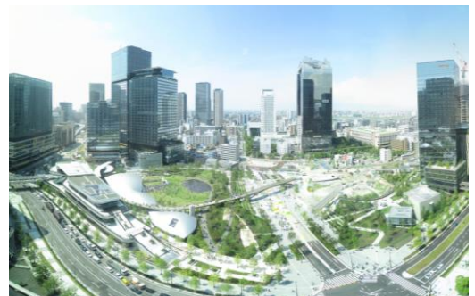
《うめきた2期区域の全景(2024年) UR都市機構》

世界水準の新しい都市空間を目指し、計画策定段階から基盤・施設整備や管理運営まで一連のまちづくりを公民連携で進め、2024年9月に先行まちびらきを迎えた。これまでに、国際的知名度の向上、地区内への様々な企業・研究機関の集積、周辺地価への好影響に加え、幅広い年齢層が集い、脱炭素型の都市づくりや良質な緑地整備・マネジメント計画等も高く評価されるなど、エリア価値の向上に大きく寄与している。引続き都市公園等の残工事を進め、2027年度に全体まちびらきを予定している。