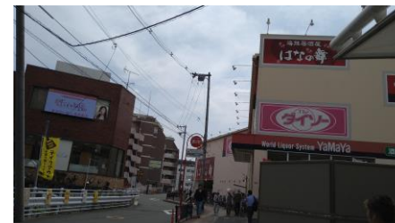
① エスカレーターから見える風景