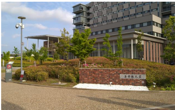
③ さらに進むと、左手に立命館大学 大阪いばらきキャンパスの北エントランスが見えてきます。 (2 ページ目に続く)