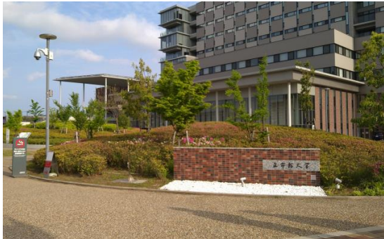
④ 北エントランスからは赤い矢印のコースで『立命館いばらきフューチャープラザ』へお越しください。