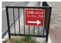
② 道なりに進むと、上記の標識が現れます。