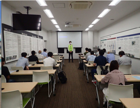
▼震災資料保管庫に到着した後、兵庫県南部地震による阪神高速道路の被災状況と復旧に関する映像を視聴しました。