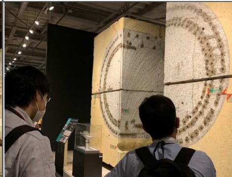
▼被災した橋脚の損傷原因や二次災害防止の補強について、実物の断面を見ながら説明していただきました。