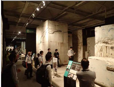
▼被災した阪神高速道路の橋脚(実物)を前に被災の状況について説明していただきました。