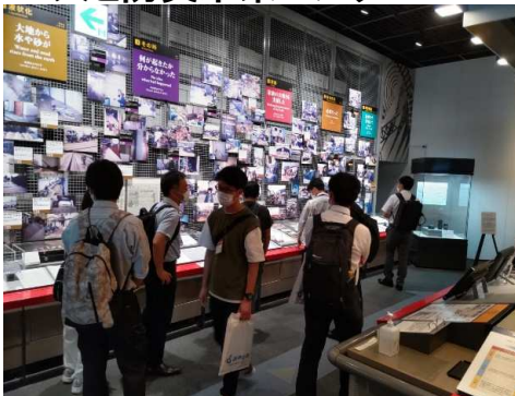
▼阪神・淡路大震災の被災状況を再現した映像を見た後、様々な震災資料を見学しました。