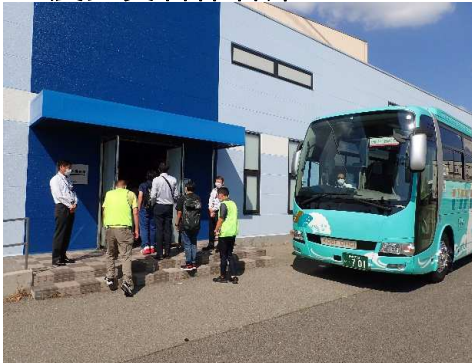
▼震災資料保管庫へ時間通りに到着しました。参加者の皆様、ご協力ありがとうございました。