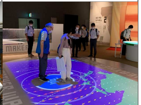
▼これからの自然災害に対する備えを学習することができました。