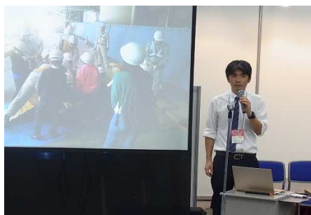
藤林副査による閉会の挨拶