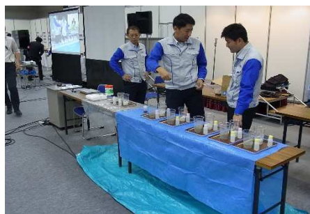
プレゼン前に実験体験用の薬剤を準備