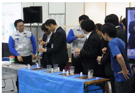
希望者による体験 本実験は数秒で固まる急硬材を使用