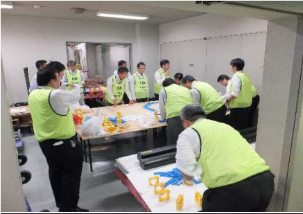
「鉄道の高架化」実験準備中