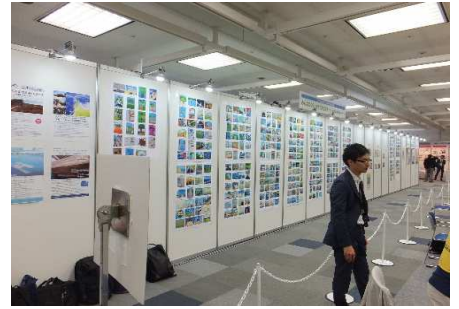
「土木の日」ポスター展示状況