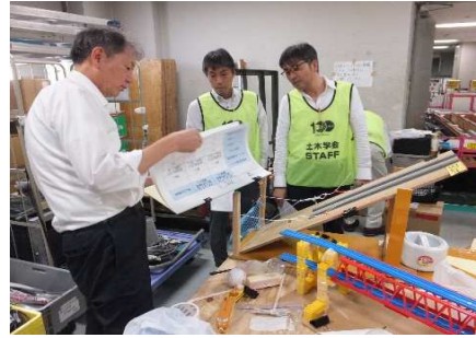
「道路の落石対策」実験レクチャー中