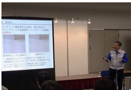
色々な種類の混和材による効果の説明