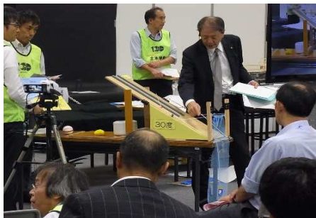
ポケット式ロックネット模型の説明