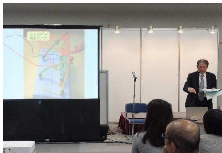
模型を使つての落石対策工法の説明