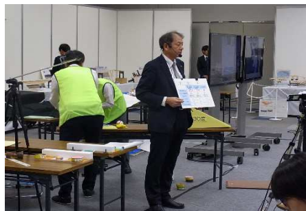
実験の結果をボードを使って、 分かりやすく説明