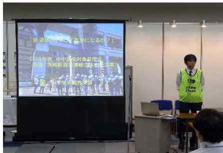
鉄道の高架化工事がなぜ必要なのか説明