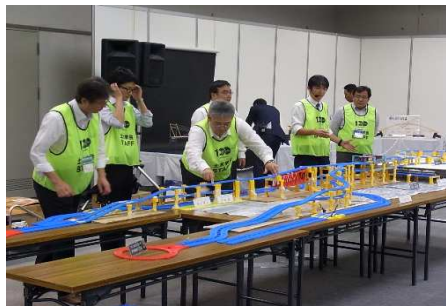
工事の手順とポイントを説明しながら、プラレールを使って再現