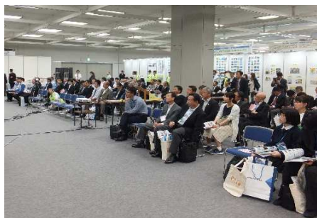
大勢の方が聴講されました。