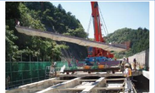
イメージ（当日の作業は異なる場合があります）