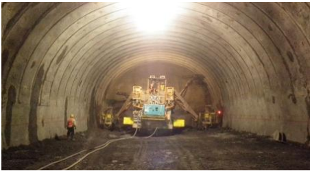
トンネル工事現場