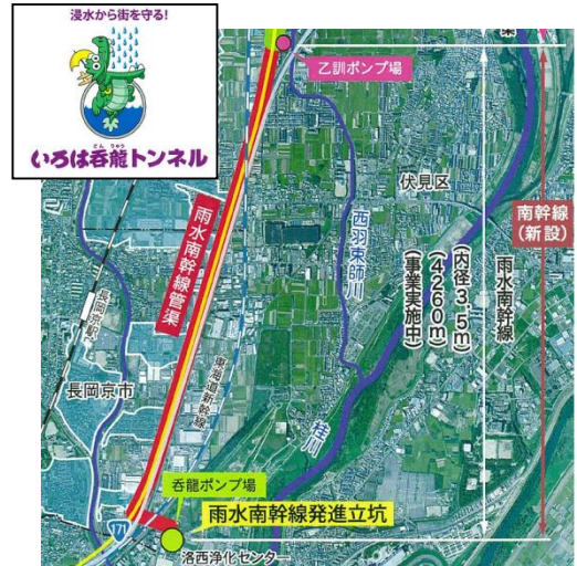
桂川右岸流域下水道幹線管渠工事 工事概要